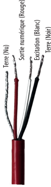
Figure 2 : Fils du câble pigtail

Raccordez les fils à l'enregistreur de données comme illustré dans la Figure 3, en reliant le fil d'alimentation (blanc) à l'excitation, le fil de sortie numérique (rouge) à l'entrée numérique et le fil de terre nu à la terre. (Figure 2)